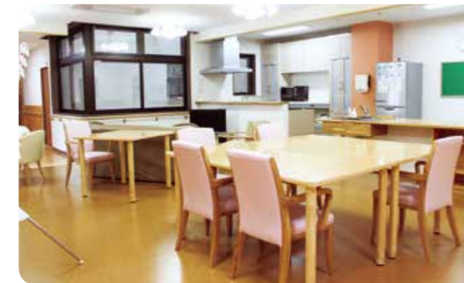
■ ユニット共有スペース