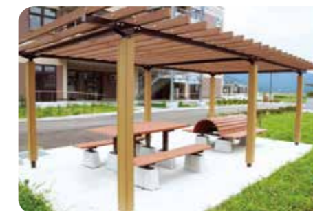
■ リフレッシュスペース