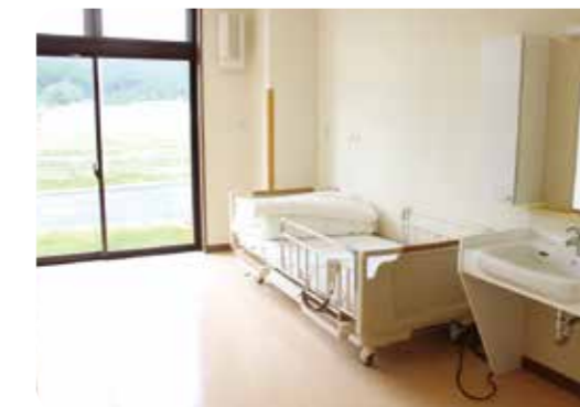
■ 明るくゆったりとした居室