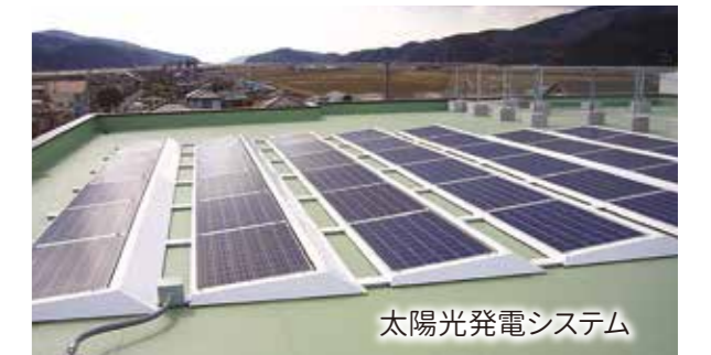
太陽光発電システム

特別養護老人ホームはしうらは、石巻市より旧石巻市外では初めて「津波避難ビル」に認定されました。 (収容可能人数 1,519 名)