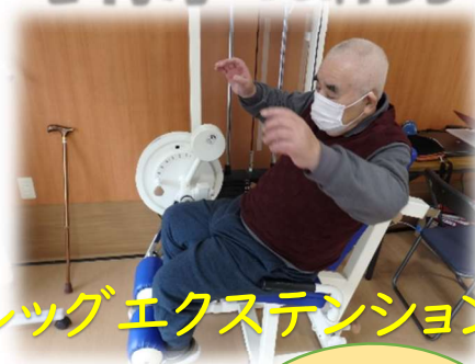
レッグエクステンション